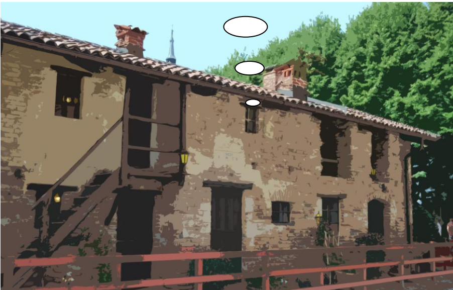
Het ouderlijk huisje van de Bosco's